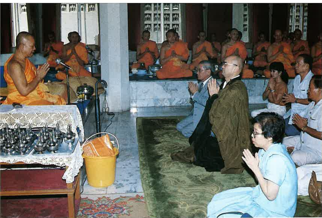
ワット・パクナム御住職から施しへの感謝の言葉を受ける