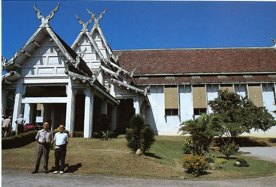
▼チェンマイ国立博物館を見学