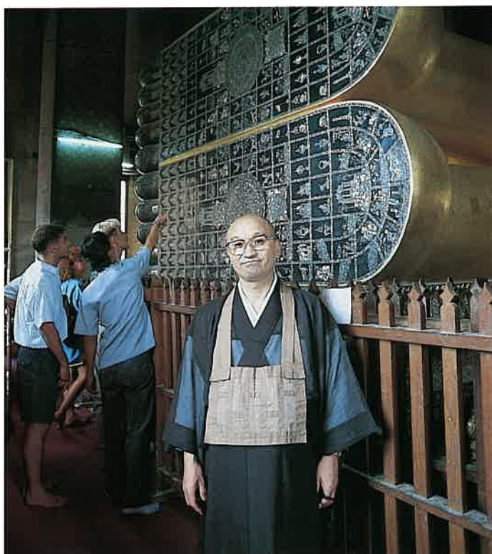
ワット・ポーの寢釈迦佛足の前で