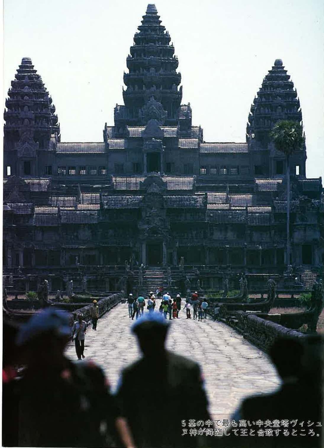
5 基の中で最も高い中央堂塔ヴィシュヌ神が降臨して王と合致するところ。