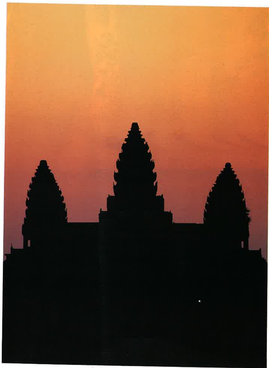
夕映えに浮かぶ本殿尖塔