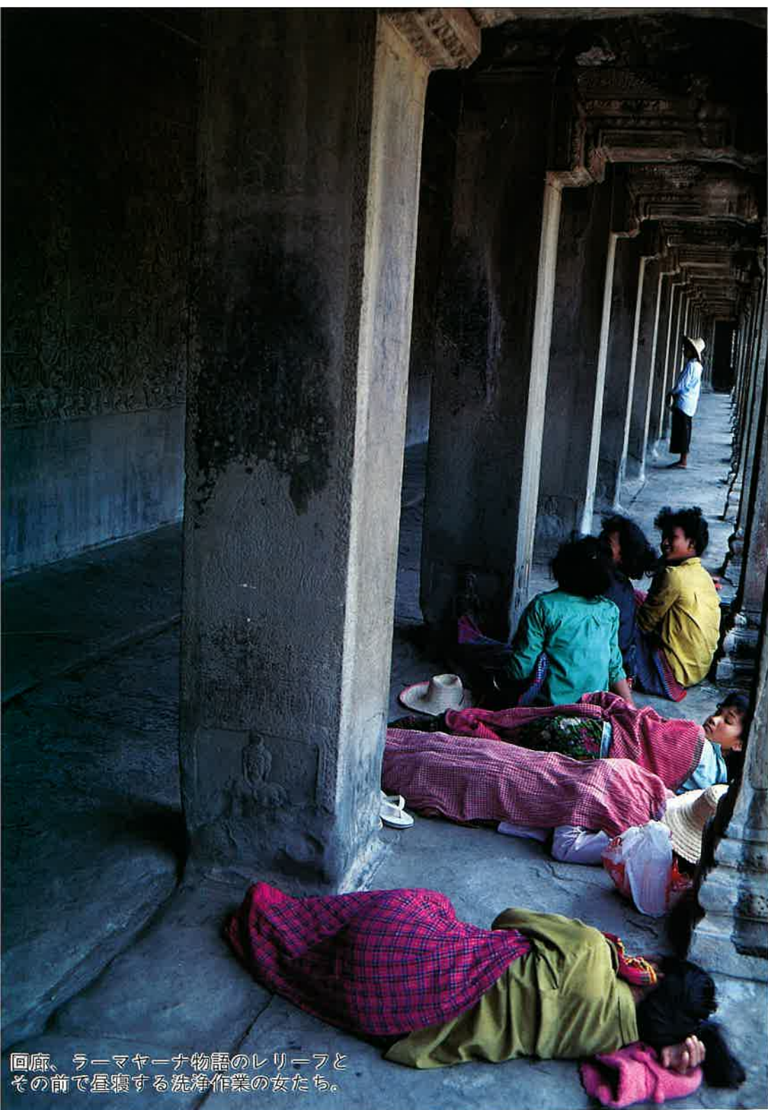
回廊、ラーマヤーナ物語のレリーフと その前で昼寝する洗浄作業の女たち。