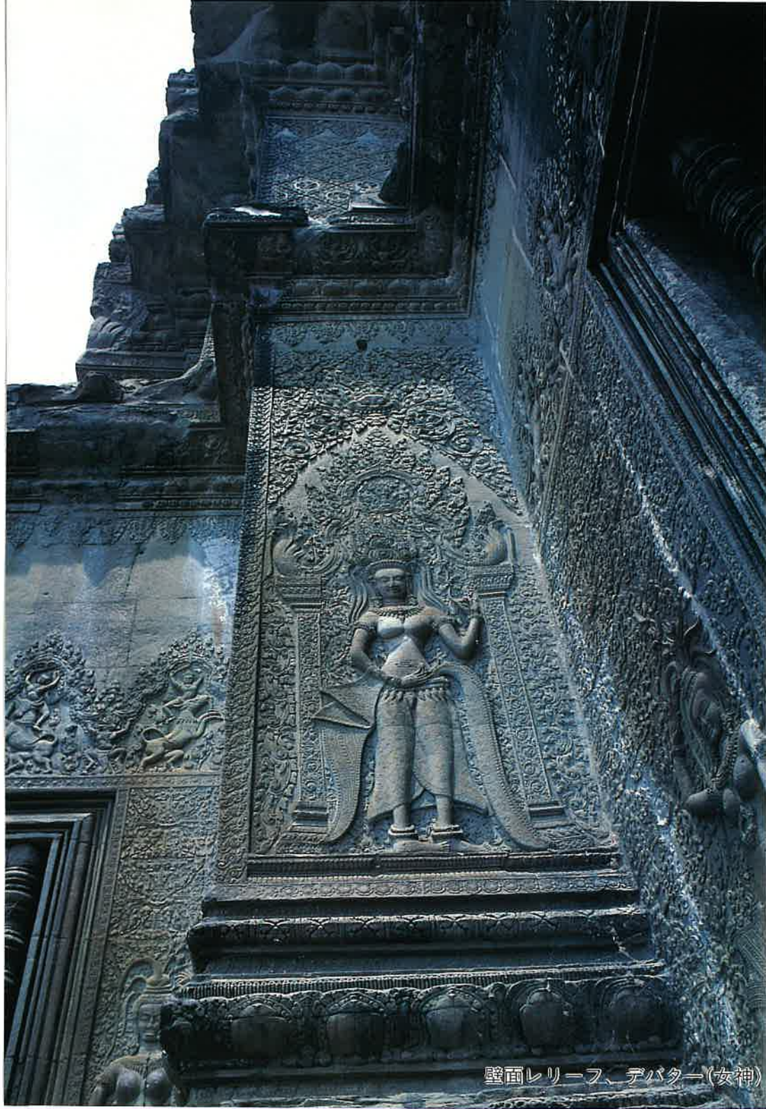
壁面レリーフ、デバター(女神)