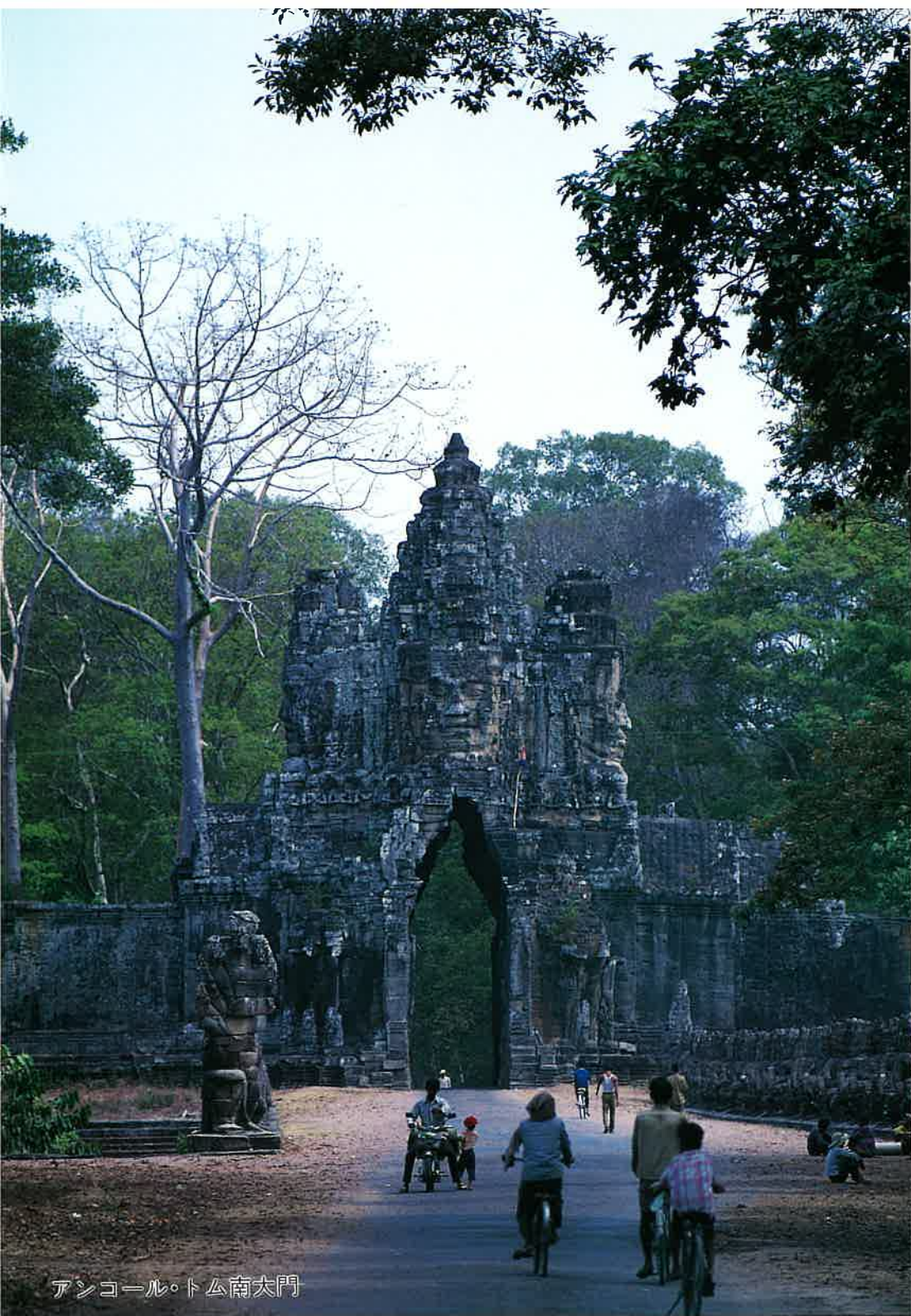
アンコール・トム南大門