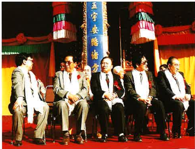
明暘禪師と理事長