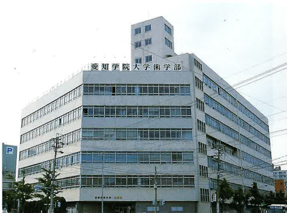
楠元キャンパスから徒歩5分のところにある歯学部附属病院。 中部地区歯科医療の中心的存在です。