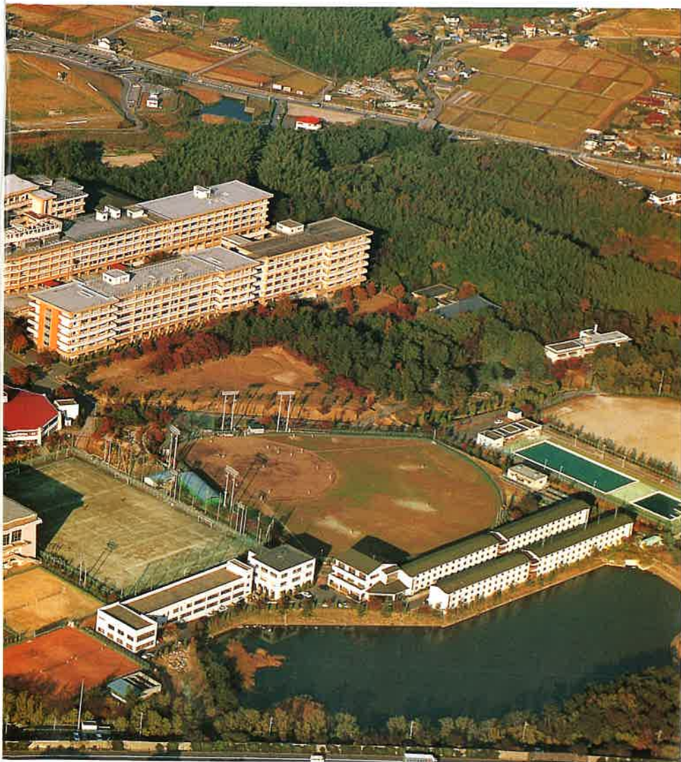
愛知学院大学のメインキャンパスである日進キャンパスは、名古屋市の東に隣接する日進市にあります。敷地面積は約50万平方メートル。