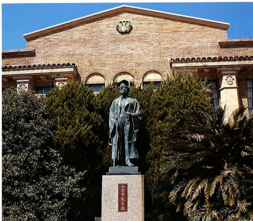
名古屋市千種区にある楠元キャンパスの1号館。楠元キャンパスでは歯学部の特設教育課程、ならびに短期大学、専門学校が授業がおこなわれています。