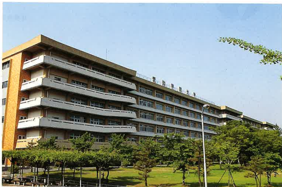
講義用の教室や研究室がある6・7号館。 最上階の6階には大学院事務室や大学院専用図書室などもあります。