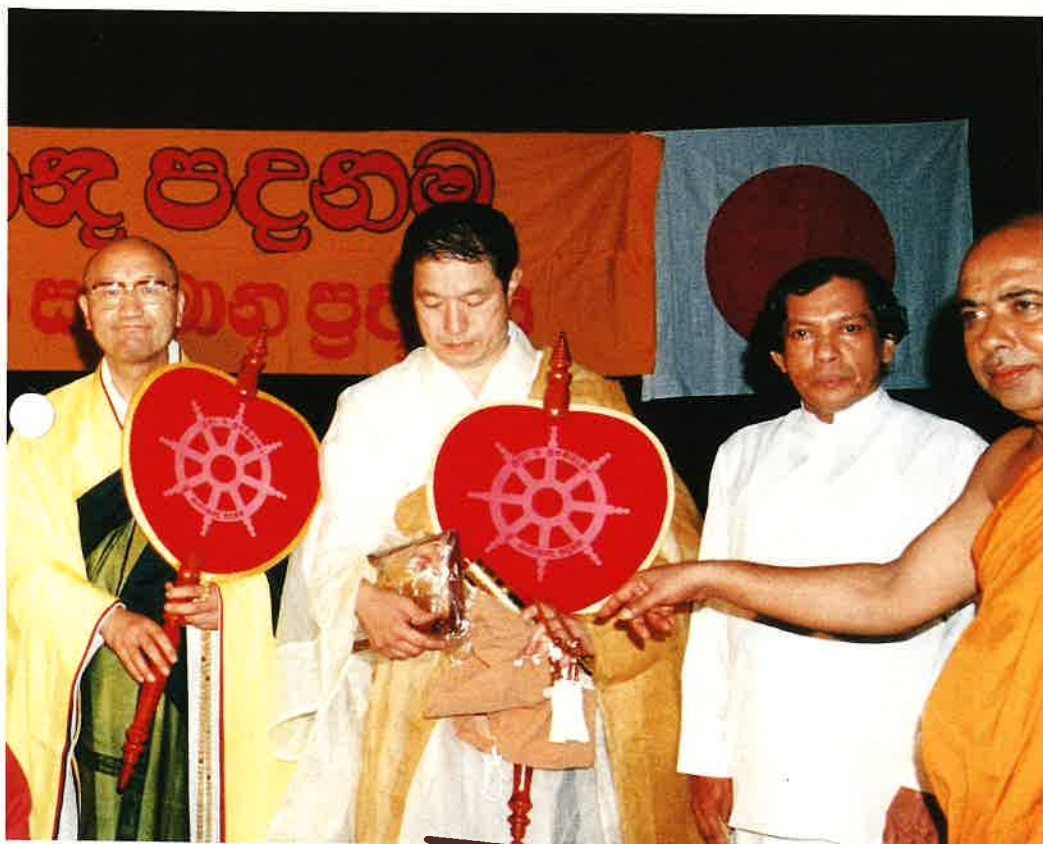
喜びの受賞者の皆様（6月20日午後）