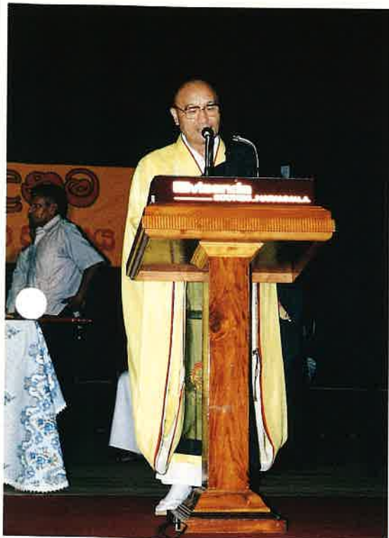
受賞者を代表して挨拶