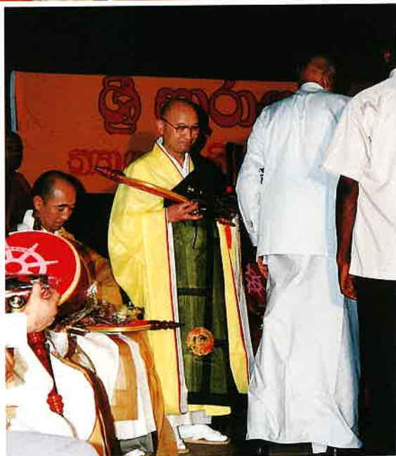
ラタナヤケ国会議長から記念の楯を受ける