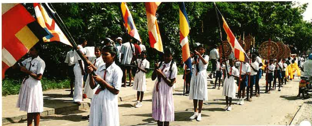
子どもたちの大歓迎パレード