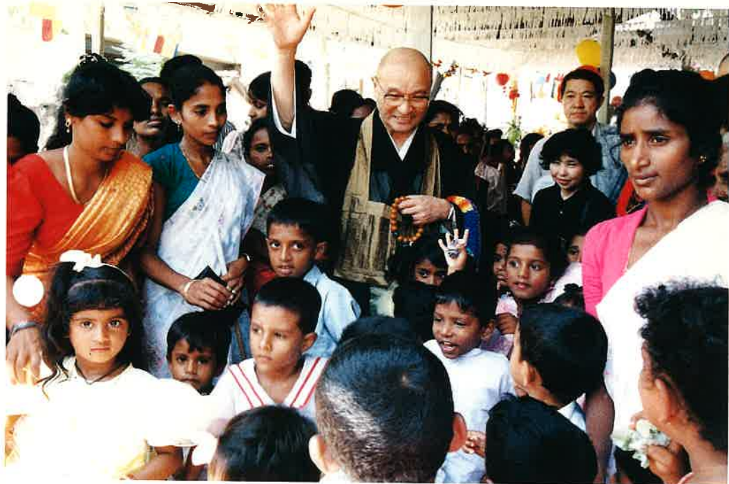
幼稚園訪問 子どもたちの歓迎（6月19日午前）