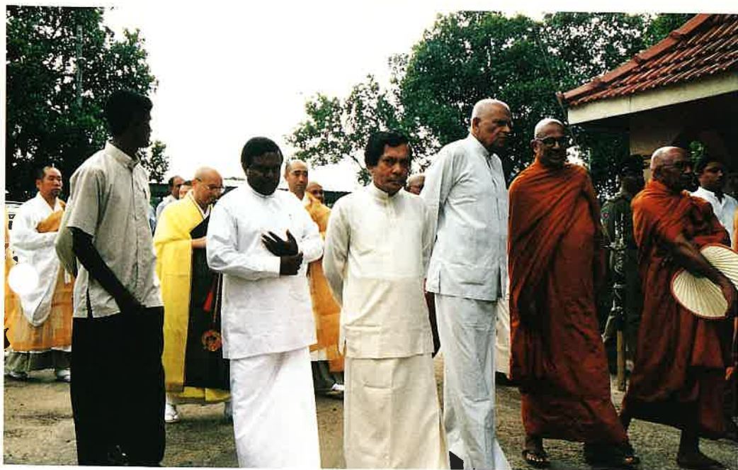
大歓迎を受けて式典会場へ