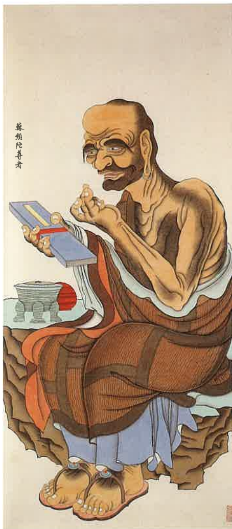
第四尊者 蘇頻陀尊者