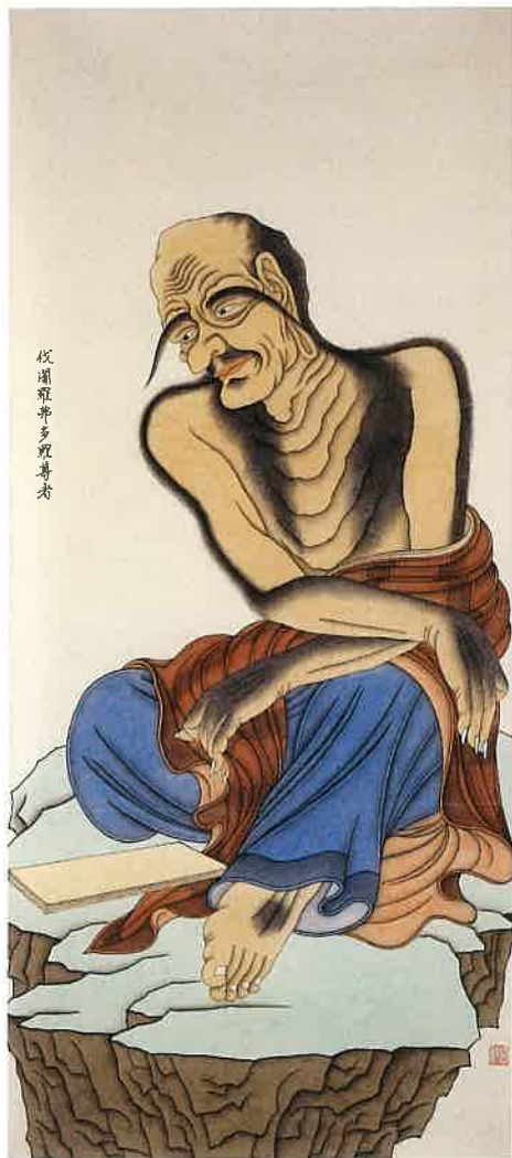
伐闍羅弗多羅尊者