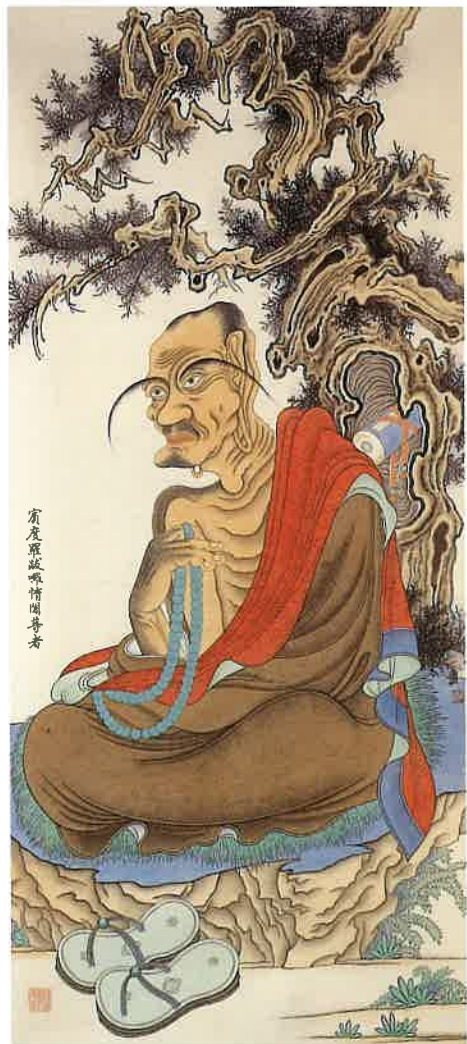
第一尊者 賓度羅跋囉惰閣尊者