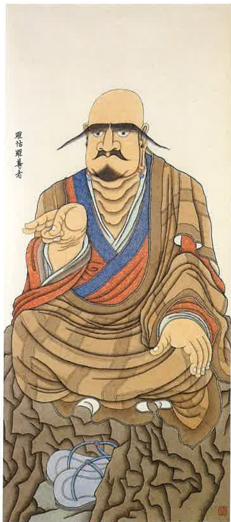
第十一尊者 羅怛羅尊者