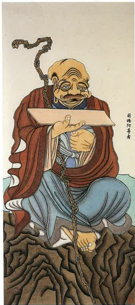
第十三尊者 因揭陀尊者