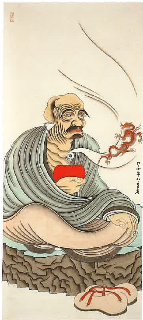
第十二尊者 那伽犀那尊者