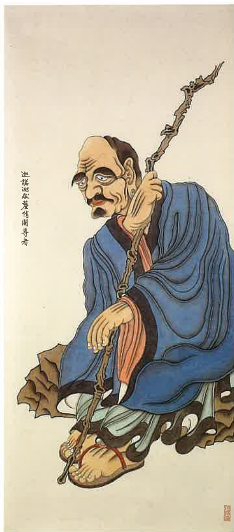
第三尊者 迦諾迦跋釐醯闍尊者