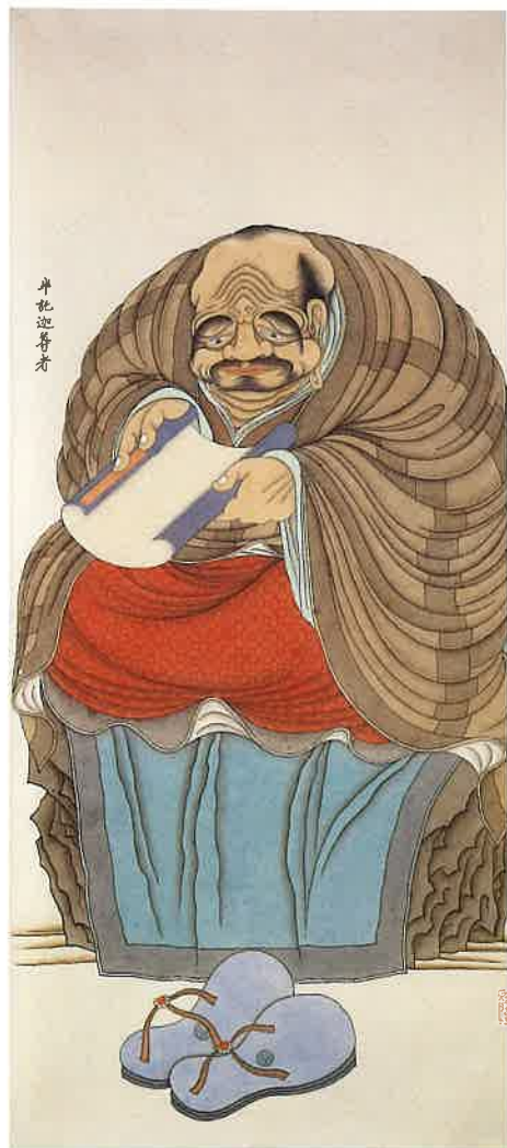
第十尊者 半託迦尊者