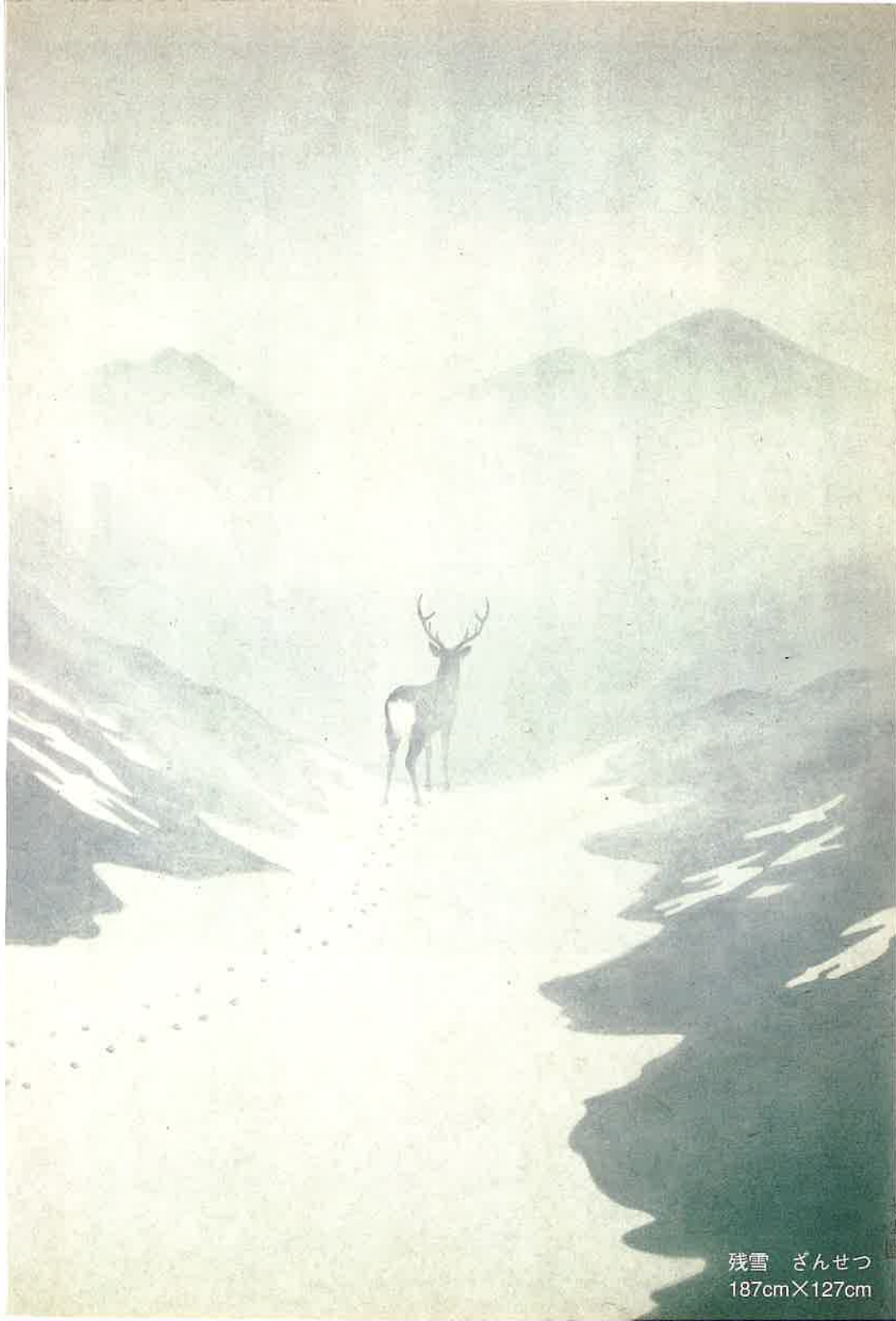
残雪 ざんせつ 187cm×127cm