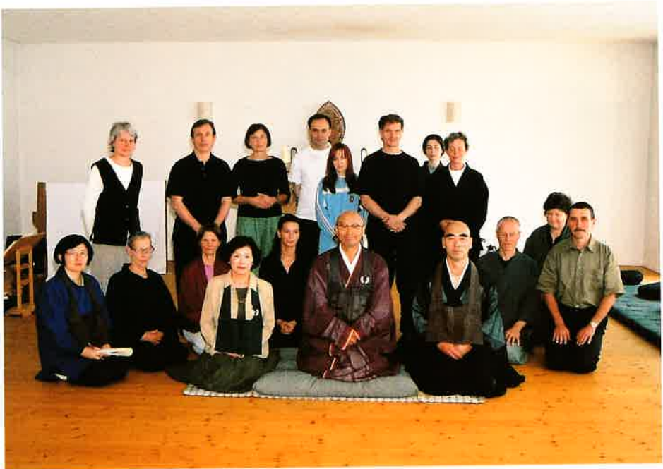
参禅が終わり全員で記念撮影