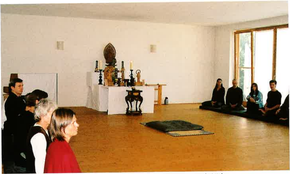
大悲山普門寺禅堂(アイゼンブッフ)での参禅会