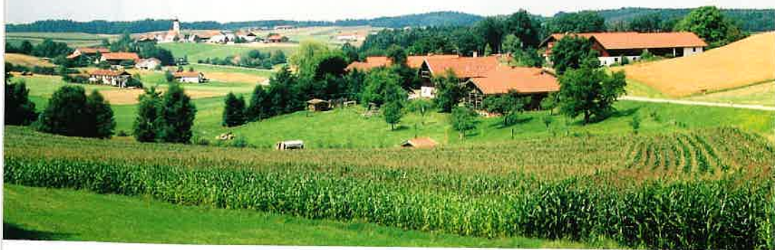
アイゼンブッフ禅センター(普門寺)全景