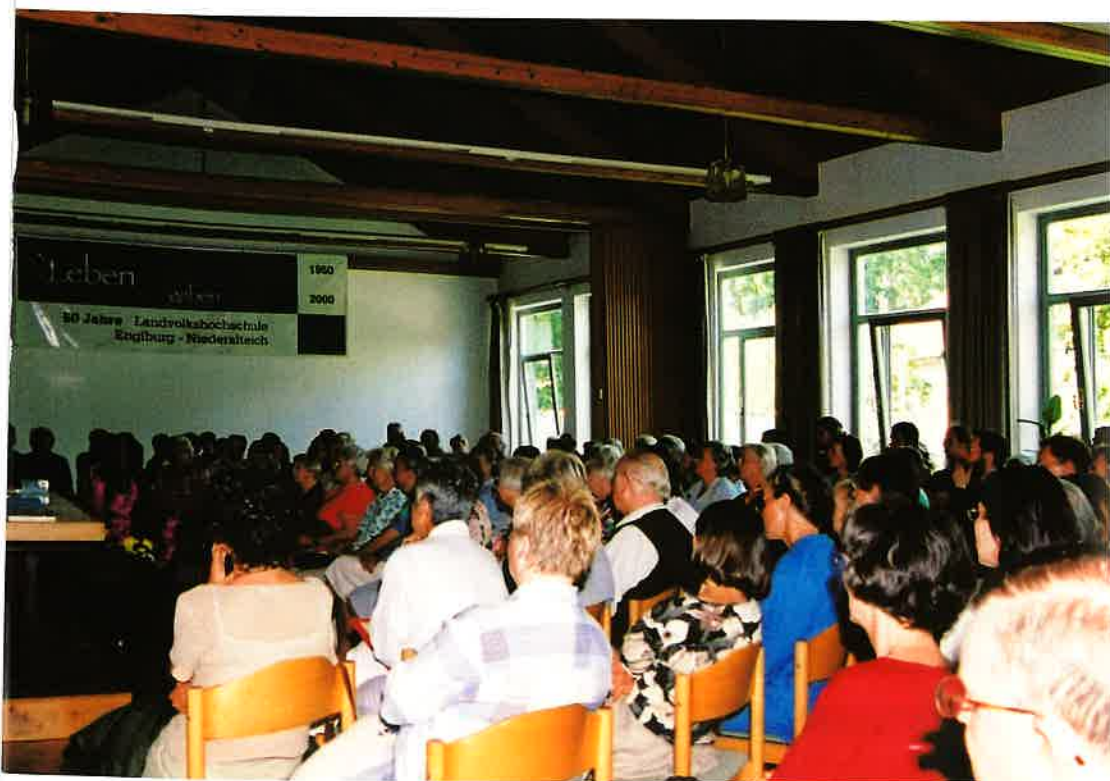
会場をうめつくした熱心な聴衆