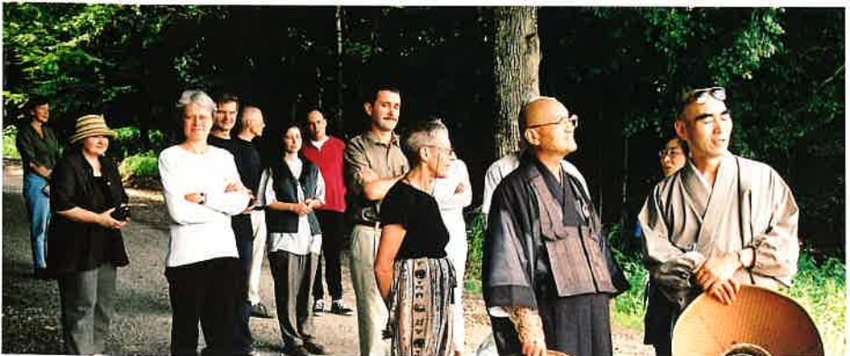
アイゼンブッフ郊外を散策する一行