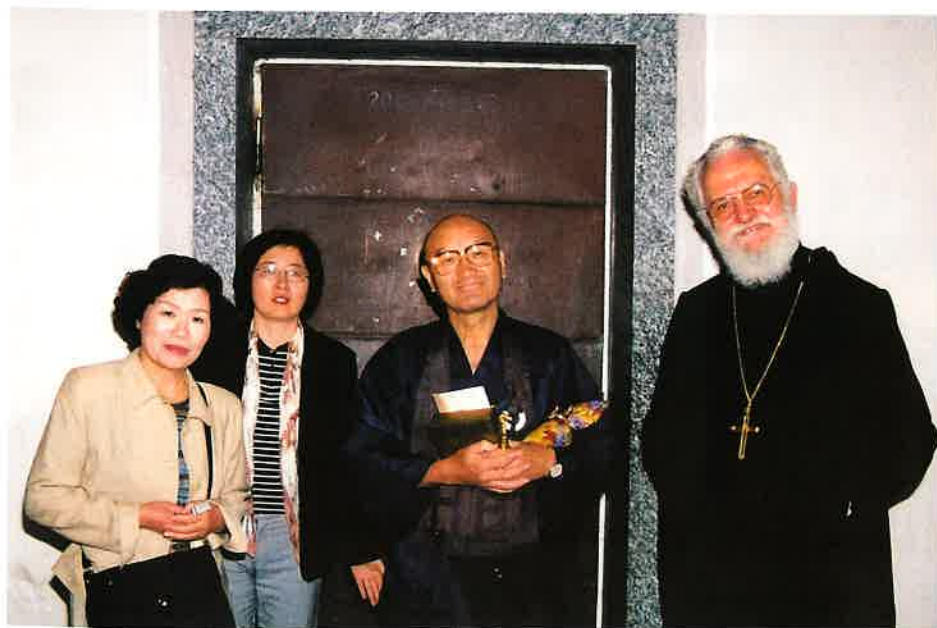
ビザンチン教会の入り口にて