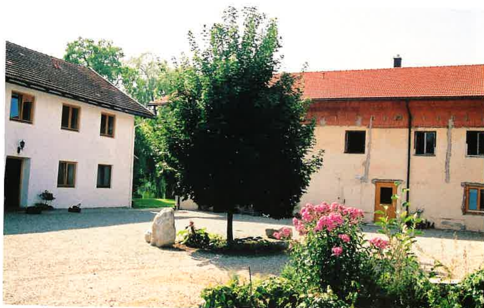
庭から眺めた禅堂(左)とセンター事務所