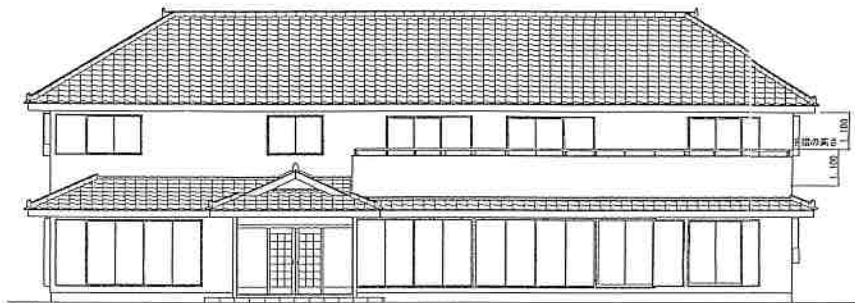
梅嘉庵完成予想図

で「般若心経」「消災呪」「不動明王慈救呪」の誦経とともに、参列者一同の焼香、そして、回向、合掌三拝、鼓鉦三通と続き、約一時間ほどのものとなりました。