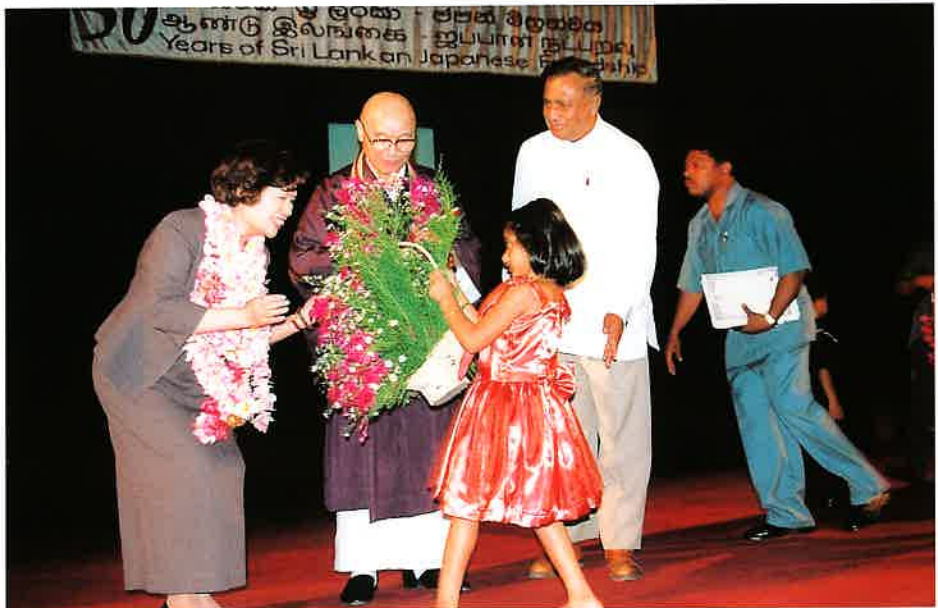
歓迎の花束を受ける黒田団長と倫子夫人