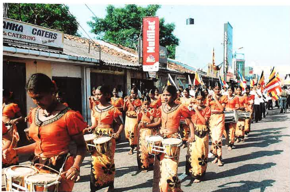
ねり歩く伝統的民族ダンスとドラム音楽隊