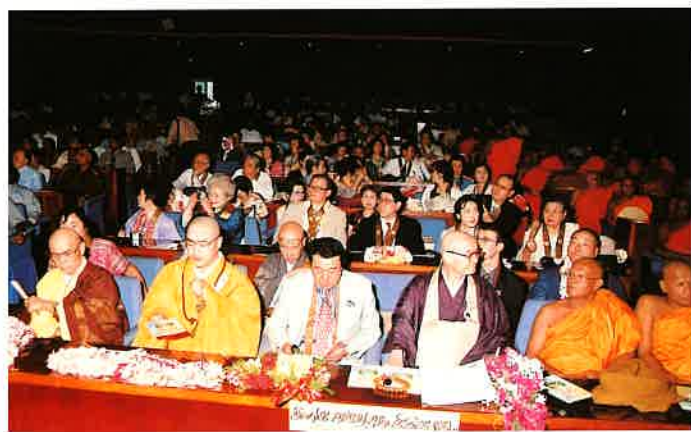
会場の訪問団一行