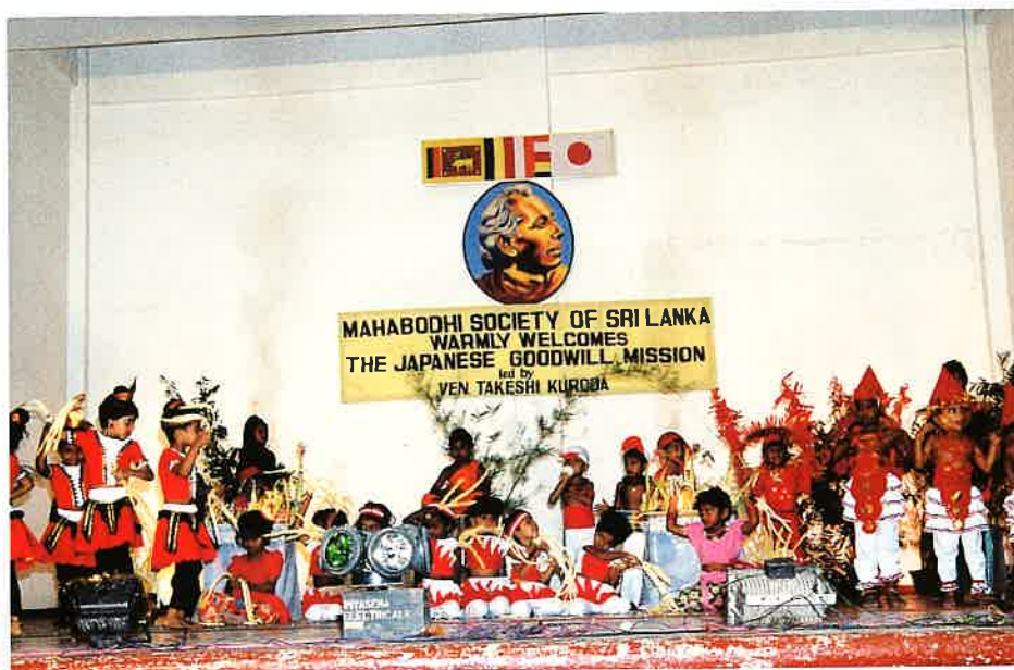
歓迎の歌と踊りを披露する子供たち