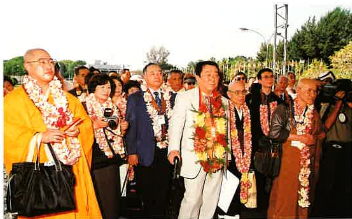
漸く辿り着いた会議場入口