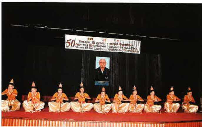
開会式を祝す儀礼の舞