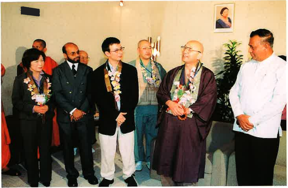
空港でコディトゥーワック大臣（右）の出迎えを受ける