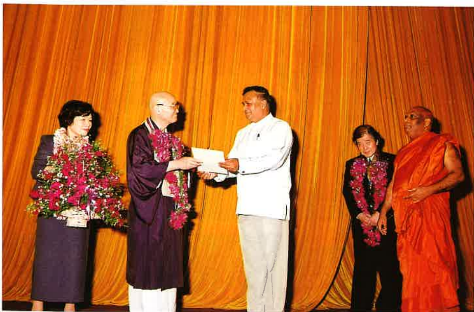
コデイトワーク大臣から感謝状が贈られる