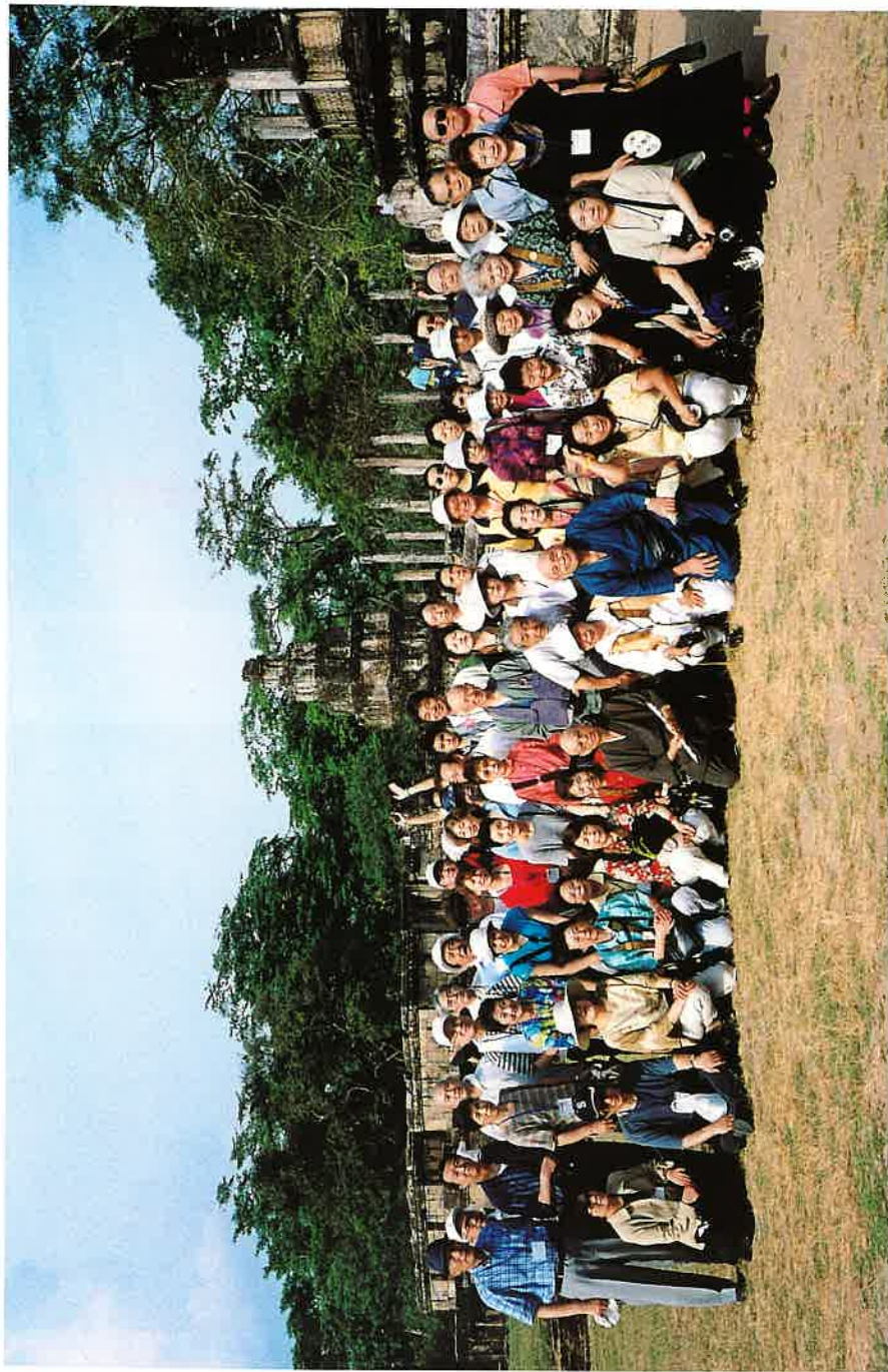
12・13世紀シンハラ王朝時代の遺跡ポロナルワでの親善使節団