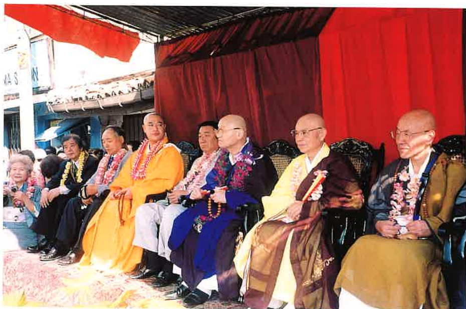
大菩提会での歓迎式典に臨む一行