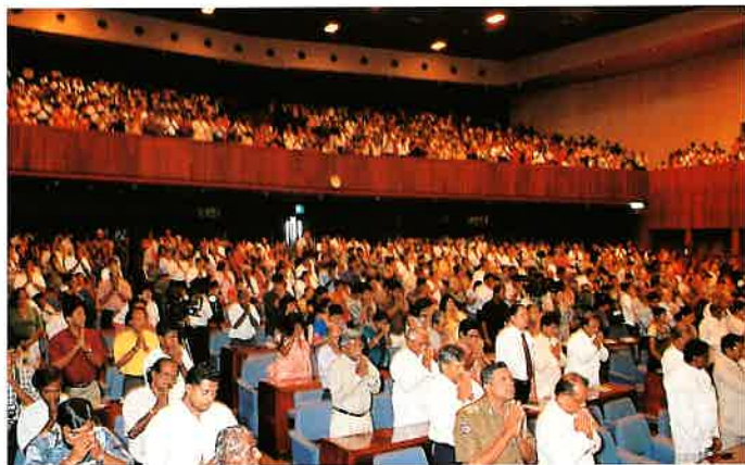
会場をうめつくした聴衆