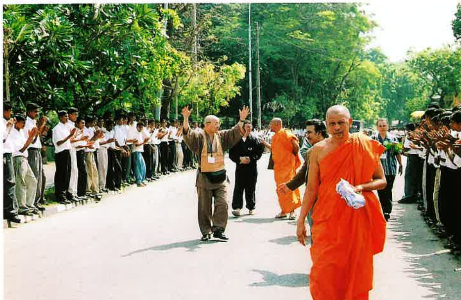
寺院参道で学生総動員による歓迎風景