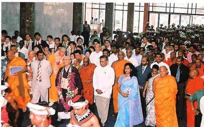
歓迎式典には多くの政府要人が出席した