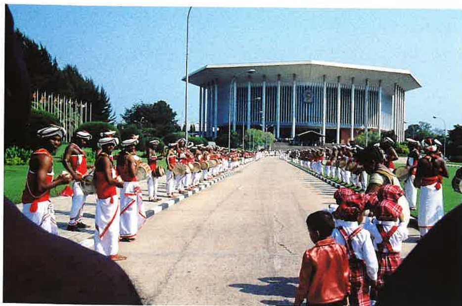
バンダラナイケ国際会議場での出迎え風景