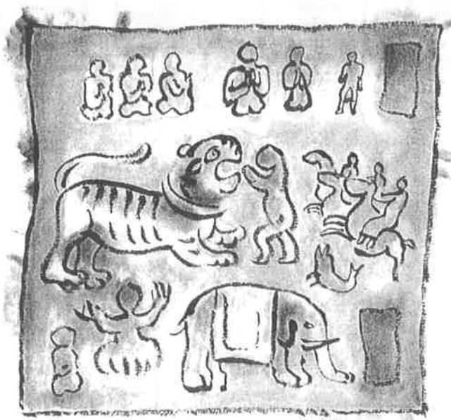
The story of Girellans 9th century