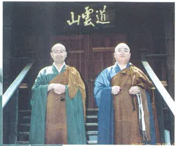
禪マウンテンセンター法堂 先代方丈(左)と東老師(右)